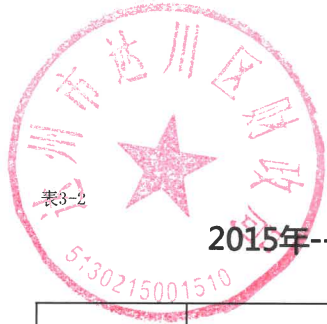
表3-2 2015年--2023年末511721 达川区发行的新增地方政府一般债券资金收支情况表